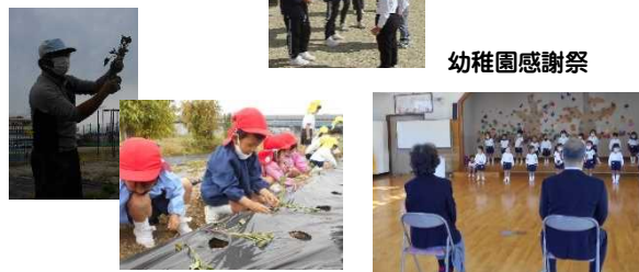
地域のおじさんと栽培活動