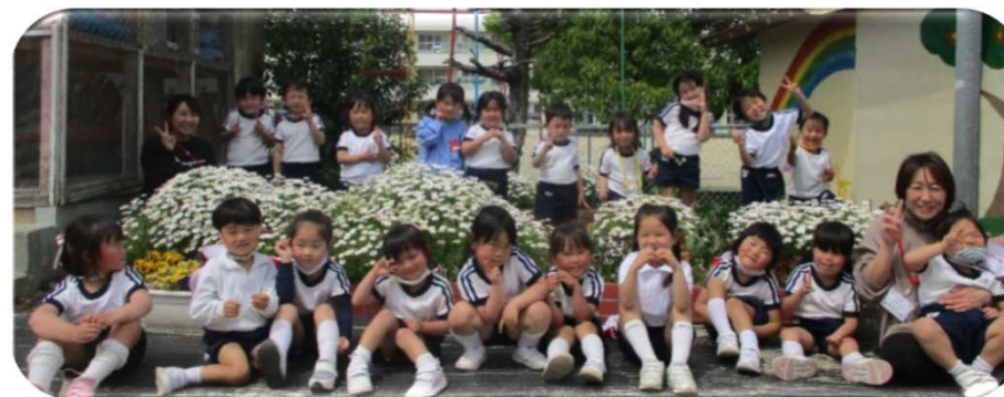
4歳児 みんなで植えた花の前で…