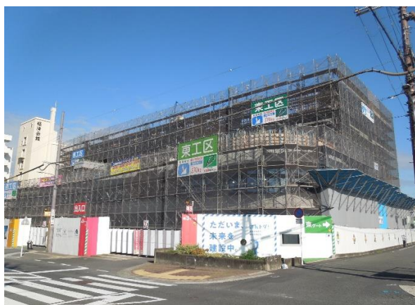
■ 工事進捗状況(全景)

市役所通りから見た全景写真です。現在、地上5階立上り部分の躯体工事を進めています。外壁塗装工事を10月初旬より低層部から順に進めてまいります。