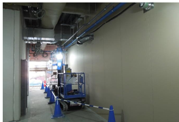
■ 1階内部壁ボード張り工事状況

2階は内部の壁下地工事に着手しています。内部建具取付けと電気配線後、ボード張り工事を行います。階高が高いため、作業には写真右側に映っている高所作業車を使用します。