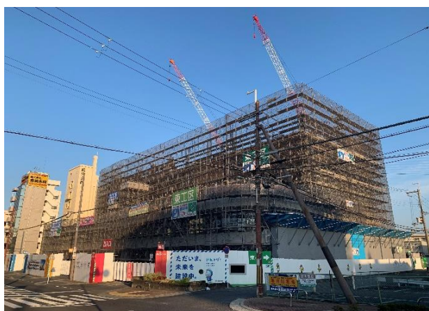
■ 工事進捗状況(全景)

11月には市役所通り低層部分の外部足場の一部を解体しますので、最終仕上げの装いがご覧いただけます。また、外構工事にも着手します。引き続き、安全第一で工事を進めてまいります。