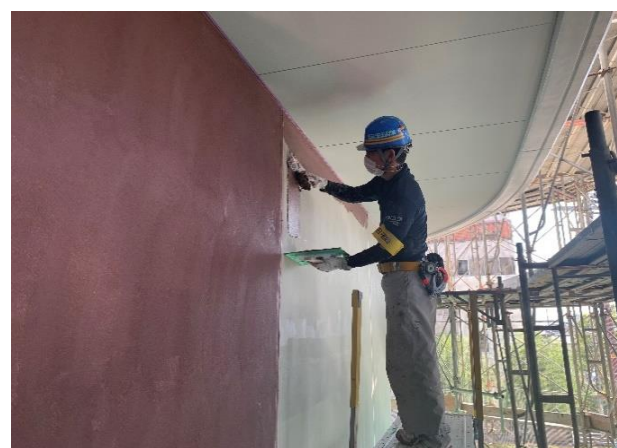
■ 2階外壁塗装工事状況

1階は、内部の天井下地・ボード張り工事に着手しています。写真は、軽量鉄骨下地の天井を組立てている状況です。この後、天井ボードを張って照明器具・設備空調機器を取付けて完成です。