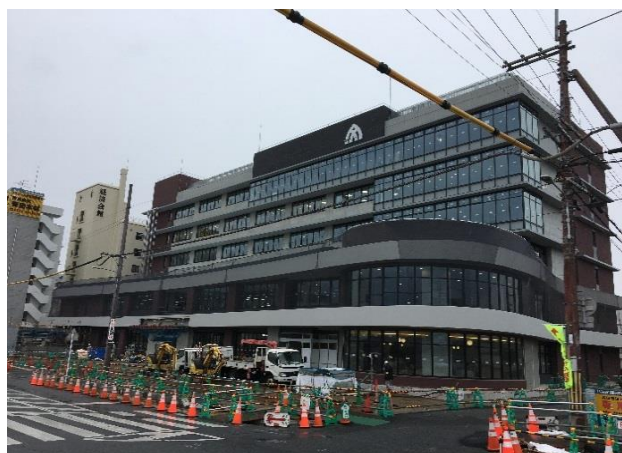
■工事進捗状況(全景)

北面・南面の外構工事では、外周部の仮囲いを撤去して作業を行っていますので、騒音・振動対策と第三者災害のないように、残り工期をより安全に注意して工事を進めてまいります。