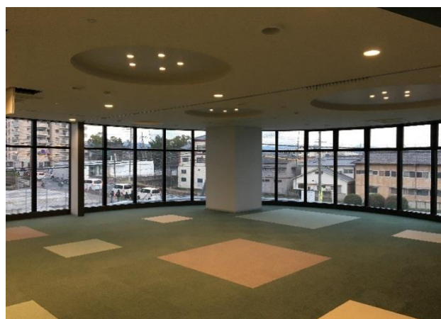
■2階 市民活動室仕上状況