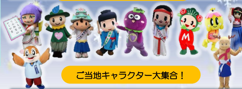
ご当地キャラクター大集合!