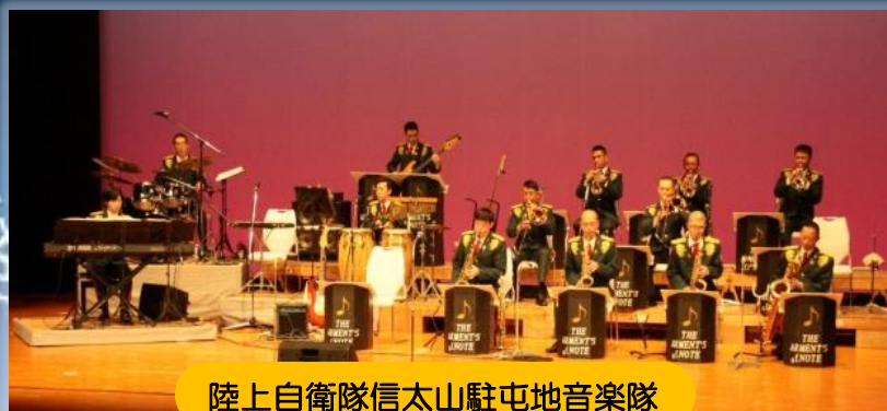
陸上自衛隊信太山駐屯地音楽隊