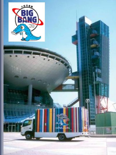
いどうミュージアム「ビッグバン」