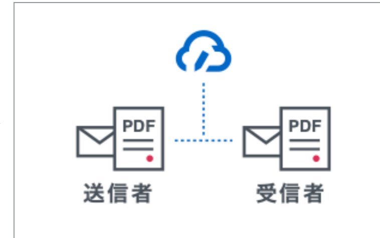
締結後書類を印刷・PDFで保管