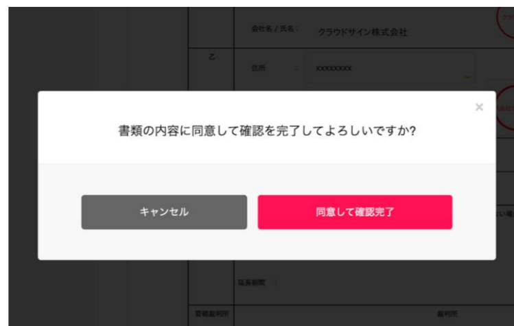
契約書確認・合意