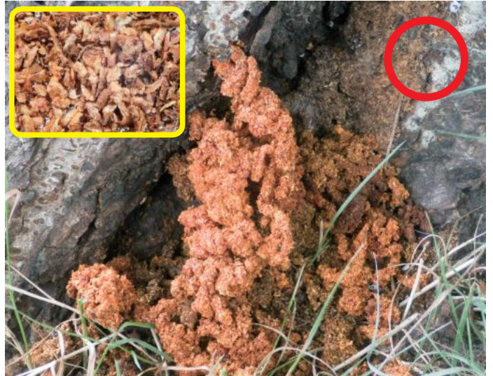
クビアカツヤカミキリの幼虫が出すフラス 枠内・指ですりつぶしてルーペで見ると、繊維質が無い