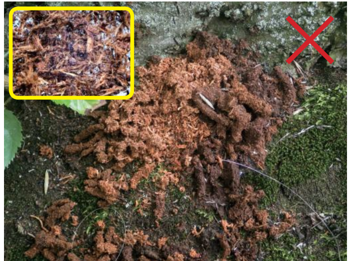
良く似たフラス（他のカミキリ） 枠内・指ですりつぶしてルーペで見ると、繊維質が多い