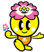
大和高田市マスコットキャラクター みくちゃん