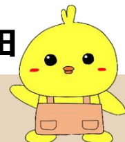
ハローワーク大和高田 公式キャラクター きまるくん