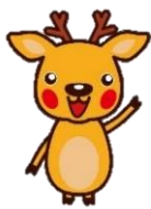
ハロくん 奈良労働局