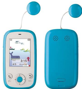
ペンダント型緊急ボタン