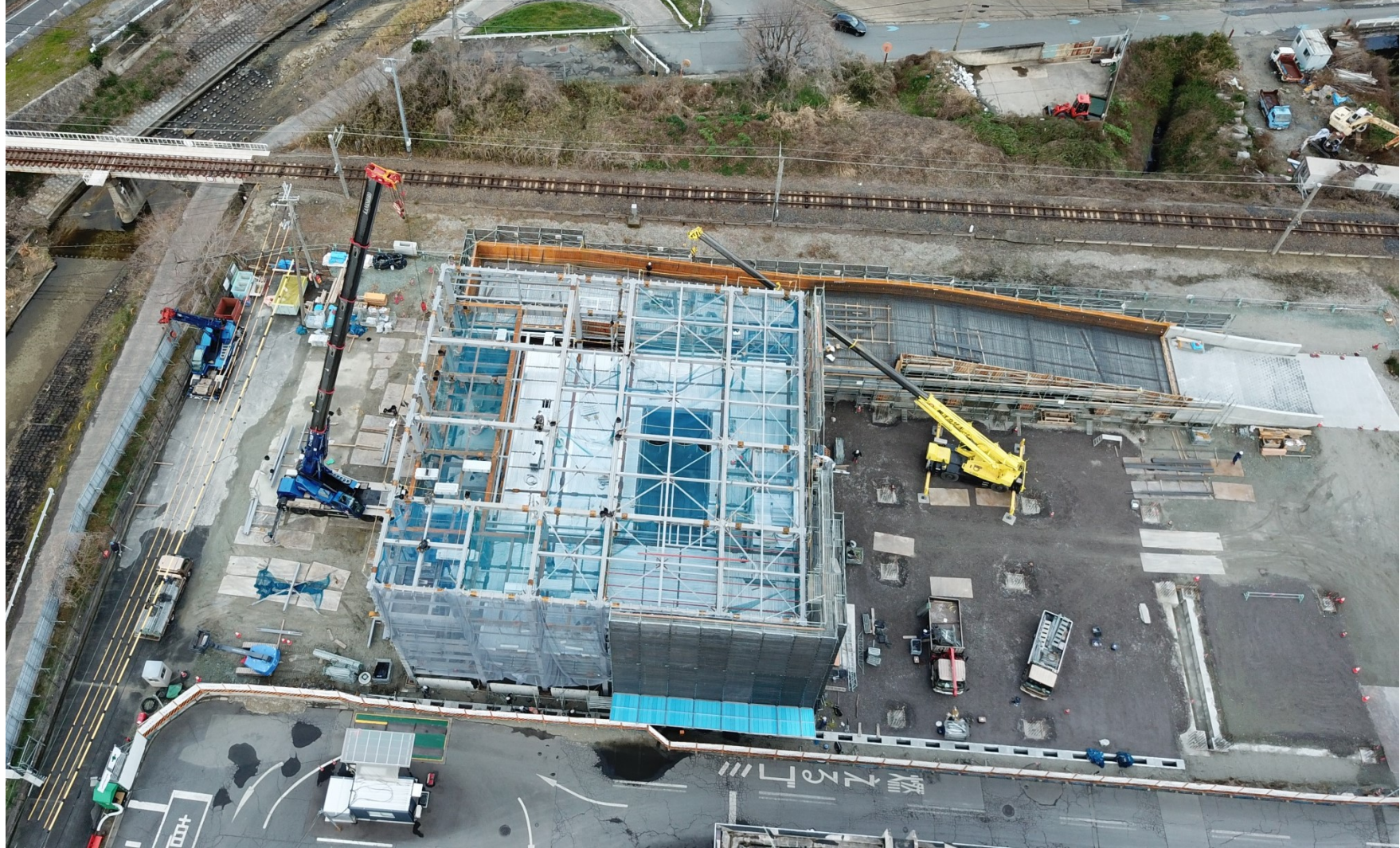
工事状況写真（全景）