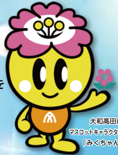
大和高田市 マスコットキャラクター 「みくちゃん」

水道局では 令和元年10月1日(火)より 業務の効率化及びサービス向上を 図るため橿原市と大和高田市が 共同で「お客さまセンター」を 開設いたします。