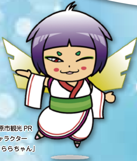
橿原市観光PR キャラクター 「さららちゃん」

水道局では 令和元年10月1日(火)より 業務の効率化及びサービス向上を 図るため橿原市と大和高田市が 共同で「お客さまセンター」を 開設いたします。