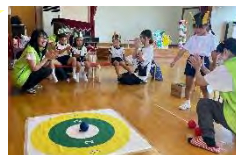
民生委員さんとポッチャ体験