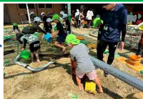
1年生との交流「夏の遊びを楽しもう！」