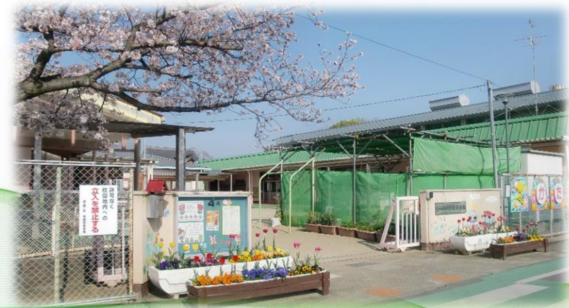
現在の東門の様子