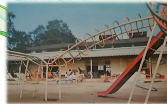
昭和47年 旭北町へ移転