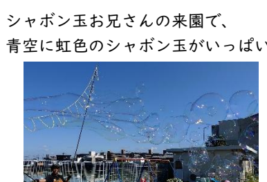
シャボン玉お兄さんの来園で、 青空に虹色のシャボン玉がいっぱい♪