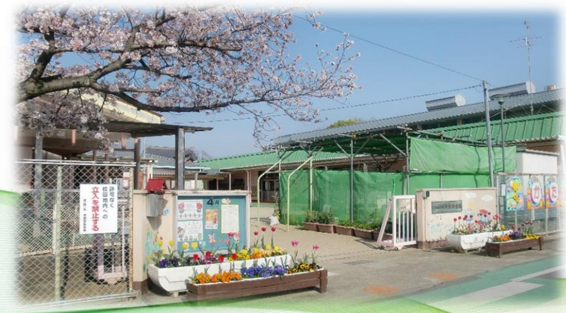
現在の東門の様子