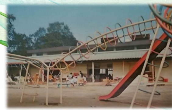
昭和47年 旭北町へ移転