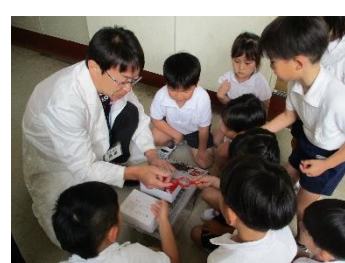
「アオムシを見つけたよ。」 「小学校の先生に聞いてみよう！」