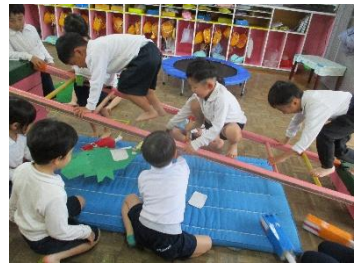
「川にはワニがいるよ。ゴオーツ」 「落ちないように橋を渡ろう！」