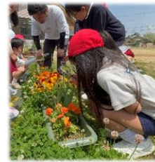
理科の授業を園庭で