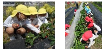
栽培活動・自然物を通して… 季節を感じる活動