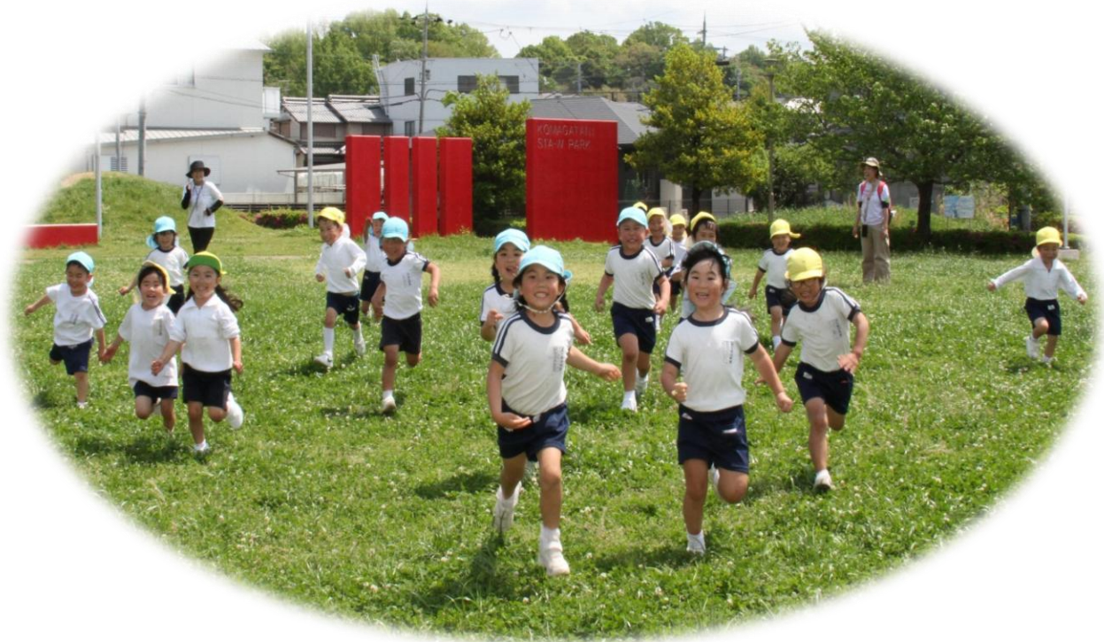
春の遠足: 石川河川公園にて