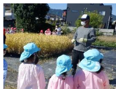
地域の方と栽培活動