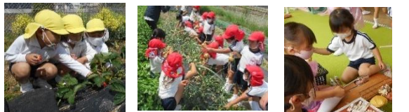
栽培活動・自然物を通して… 季節を感じる活動