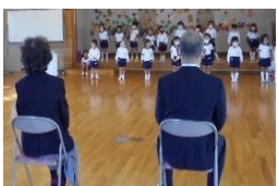
地域の方と栽培活動