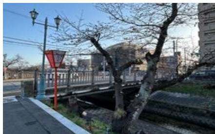
高田橋から望む高田千本桜