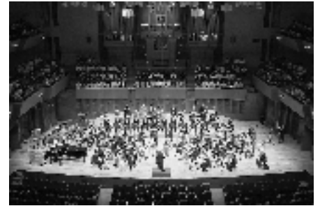
Osaka Shion Wind Orchestra

※団体割引あり(10枚以上同時購入の場合、一般2,000円、ホールのみ扱い) ※小学生から入場可 ※託児保育あり(無料・予約制2月12日(金)締切)