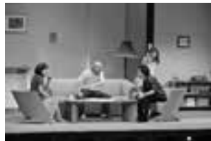
前回の公演「帰る」より

12日、13日とも 午後1時30分開場 午後2時開演 小ホール【全席自由】 一般1,000円 小学生～高校生500円