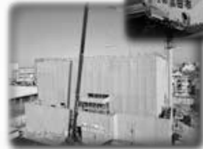
建設が進む 市民交流センター