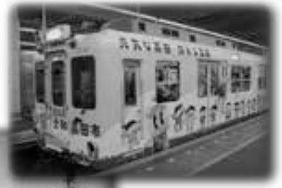
市をイメージした アートライナーが、 近鉄南大阪線で運行中

本年も、皆さまのより一層のお力添えをお願い申し上げます、新年のご挨拶といたします。