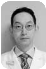
〔放射線治療科部長〕

私一人では微力ですが、各科の主治医やスタッフと協力し、チーム医療を合言葉に、市民の皆さんの役に立てるよう、懸命に努力します。