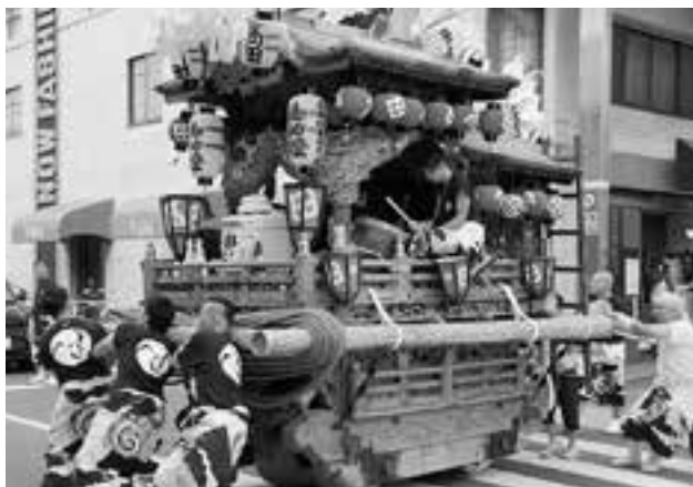
高田地車は、毎年10月に運行します