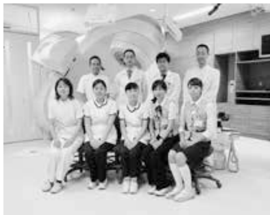
放射線治療センターのスタッフ