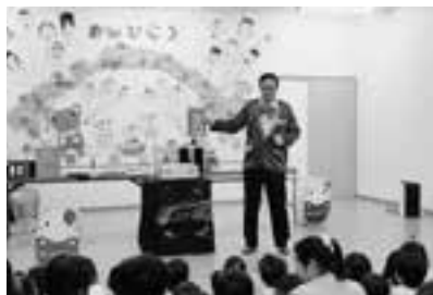
素敵なマジックに、子どもたちは大喜びでした