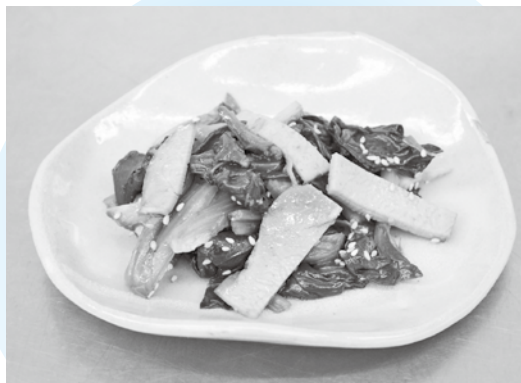
〈エネルギー 93kcal 塩分 1.4g〉(1人分)