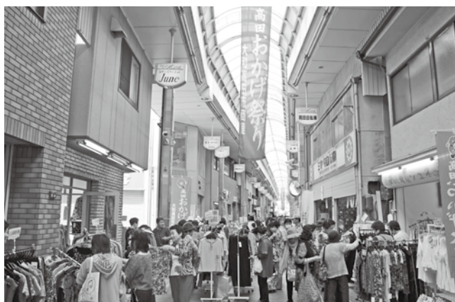
(写真は、昨年の様子です)