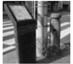
3 天神橋 (てんじんばし)