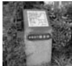
5 鎌倉橋 (ひなくらばし)