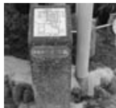
1 古川橋 (ふるかわばし)