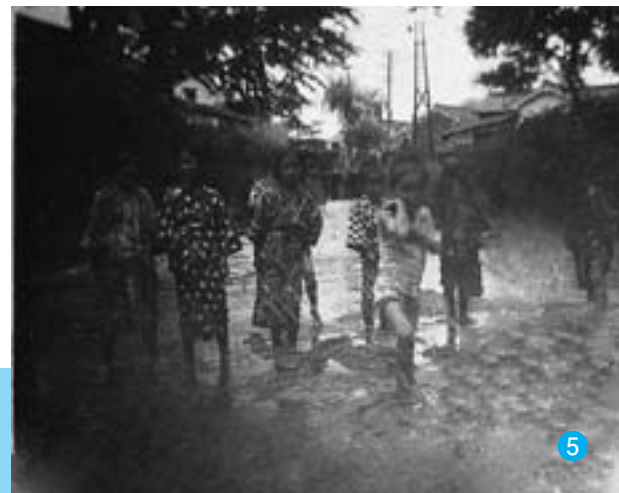
▼高田川で水あそび(古川橋あたりから北向きに撮影)

言えばいつも大漁で、今日も金盃一杯の大漁である。さて、子供との付き合い話もこの辺で終わり、本題の川の話に入りますか。川には、上流から宮前橋（竜王橋）、雑倉橋、古川橋、天神橋、好仁橋、大橋が架かっていましたが、案外と知られていないのが、沈下橋です。現在の大和信用金庫高田支店から向こう岸（村島硝子の倉庫）に渡るため架かっていた橋で、手すりの無いコンクリート製のものです、大水が出ると水中に没するようになっていました。この川は、大雨が降るとよく川水があふれたもので