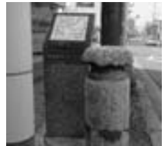
2 好仁橋 (こうじんばし)