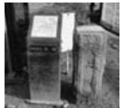
1 大橋 (おおはし)