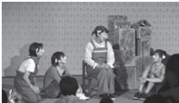
前回ファミリー劇場「さざんか村の3匹の子ぶたたち」より

ファミリー劇場とは一変し、今回の本公演では井上ひさしの戯曲でシリアスな劇に挑戦します。