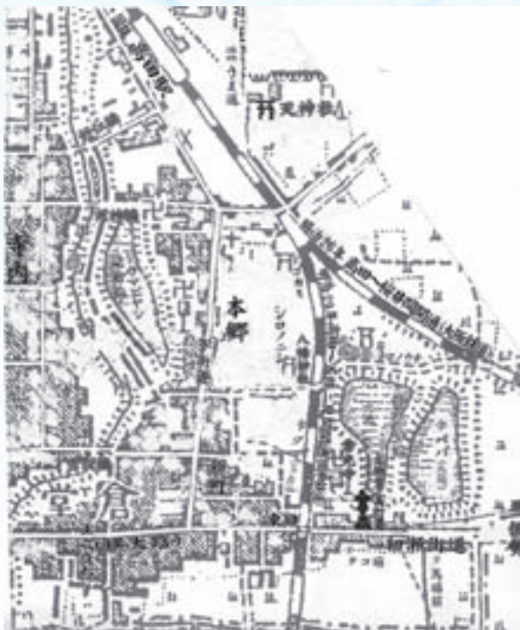
明治時代の高田の地図