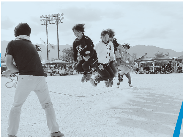
(写真は、昨年の様子です)