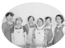
食生活改善推進員の皆さん