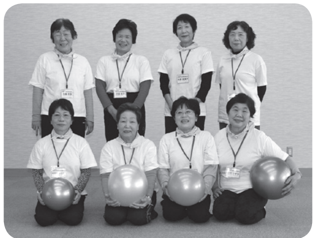
大和高田市運動普及推進員協議会のみなさん

このコーナーでは、2か月に1回、誰でもできる運動を紹介し、市民のみなさんの「+10」を応援していきます!