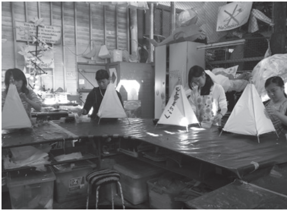
ランタンパレード用のランタン作り