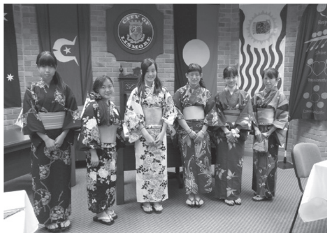
リズモー市役所訪問