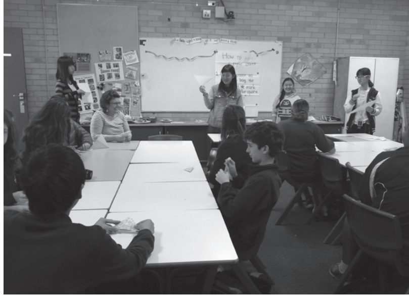
カディナ高校との交流