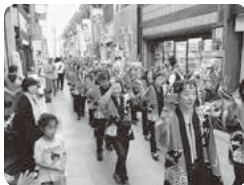
(写真は、昨年の様子です)