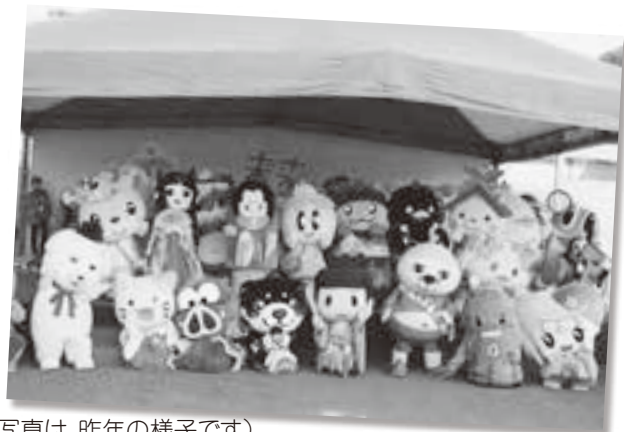
(写真は、昨年の様子です)

▷内容 ご当地キャラクター PRステージ、ご当地特産品・キャラクターグッズ販売、オープニングスペシャルライブ 石田洋介と仲間たち、子どもたちとのダンスタイム、大和高田のグルメ・うまいもん市など