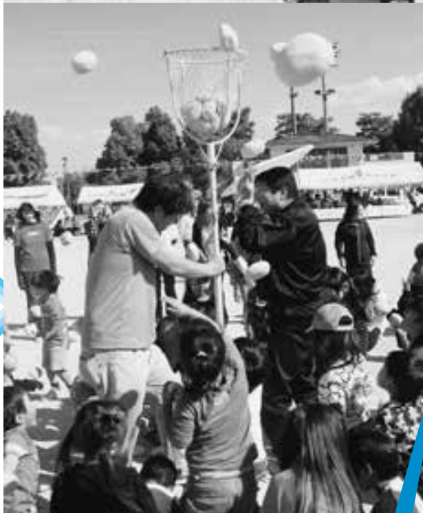
(写真は、一昨年の様子です)