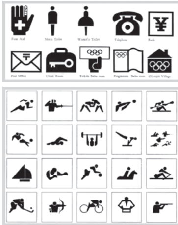
1964年東京オリンピック・パラリンピックのピクトグラム

しかし、1964年の東京大会では、言葉・文化・宗教などの「ちがいが」が問題になりました。そこで、日本語がわからない外国人の人たちのために、競技内容や、案内表示などをわかりやすく伝えるために考案されたのが、単純化した図記号をもちいた案内表示である「ピクトグラム（絵文字）」です。このピクトグラムを使ったことがきっかけとなり、1980年代以降、日常生活のさまざまな場面でピクトグラムが使われるようになりました。これを考案したデザイナーたちは、社会に還元することを目的に、著作権を放棄しました。それにより、ピクトグラムは世界中に広がり、オリンピック