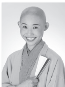
つゆ まるこ 露の団姫

上方落語協会所属の落語家。高座の他にもテレビ・ラジオで活動中。2011年に出家。天台宗の僧侶でもある。年間250席以上の高座と仏教のPRを両立し、全国を奔走する異色の落語家。