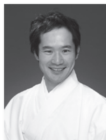
ほうらいや だいじろう 豊来家大治朗

上方落語協会所属の落語家。高座の他にもテレビ・ラジオで活動中。2011年に出家。天台宗の僧侶でもある。年間250席以上の高座と仏教のPRを両立し、全国を奔走する異色の落語家。