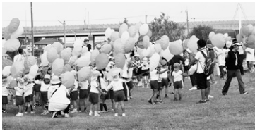
(都市計画課 公園係 内線689)