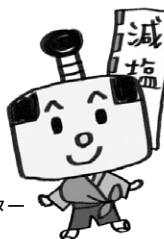
奈良県減塩キャラクター げんえもん