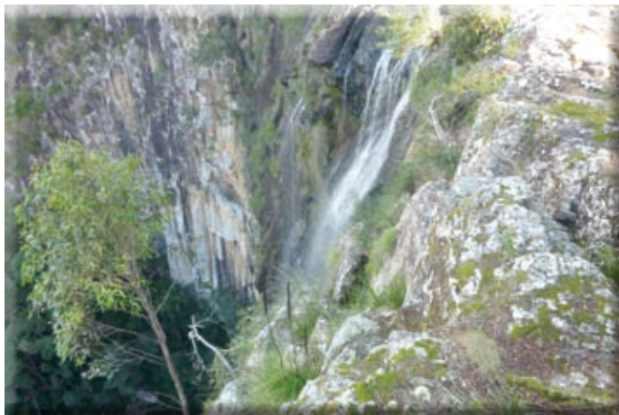
▲ミニヨンホールズにて

今回、歴史ある交換留学制度に参加してくれた4人の学生たちには、この経験を忘れることなく、今後の生活に活かしてほしいです。本当にありがとうございました。