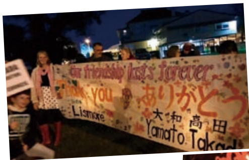
2019年 ランタンパレードの様子