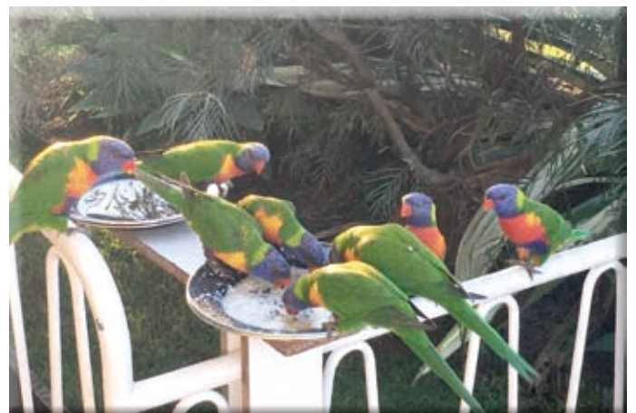
▲現地での鳥：レインボー・ロリキートの様子