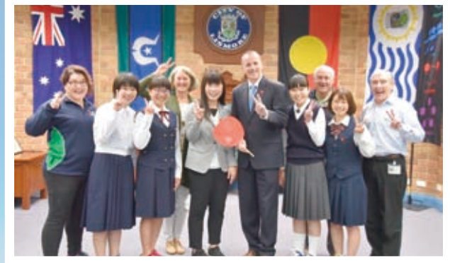
▲リズモー市到着後、市役所内にて

リズモー市での滞在は、学生にも私にとってもそれぞれ充実した2週間でした。毎日が刺激的で、時間が過ぎるのがあっという間でした。