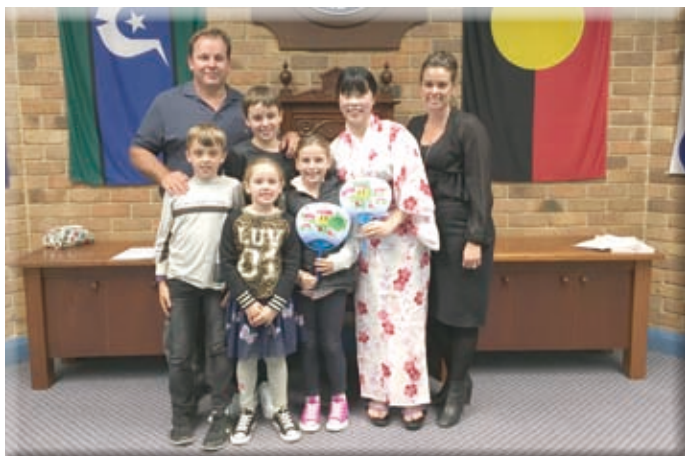
▲ホストファミリーとさよならパーティーにて