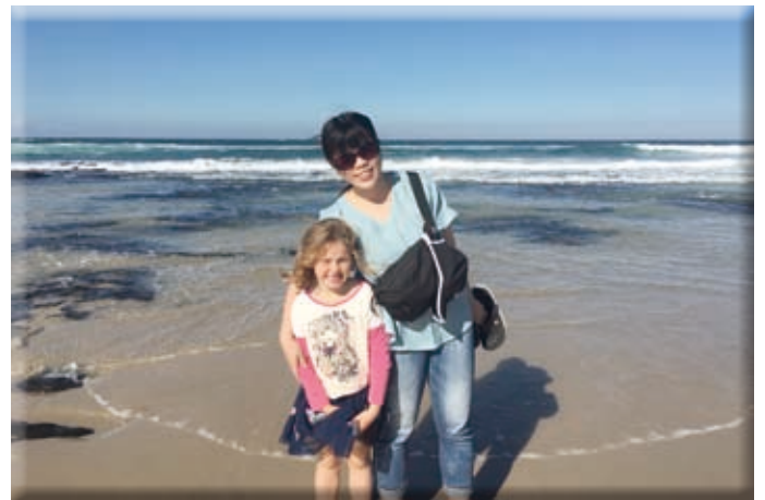
▲ホストファミリー先の子ともとパイロンベイ近くの海岸にて