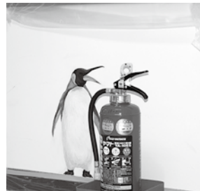
▲ペンギンと消火器は、仲良しです！