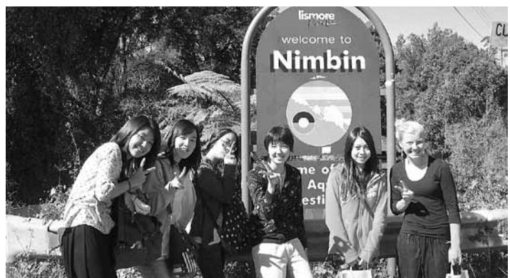
▲タウン誌の取材も受けました