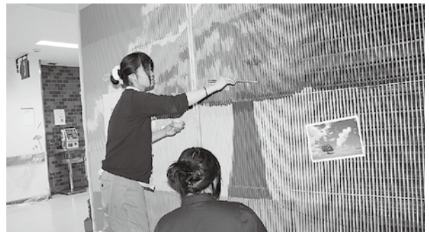
▲大自然の冷風が吹くような