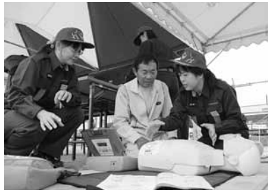
※写真は昨年の様子

これらのことを踏まえ、実際に地震などの災害が発生したことを想定し、危機感を持ち、防災意識を高める訓練を行います。