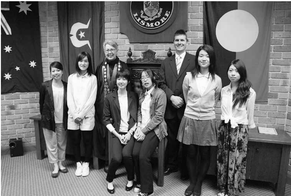
▲ジェニーダウエル市長(左) ゼネラルマネージャー グレイ・フォーシーさん(右)

7月25日からリズモー市を訪問していた、大和高田市の派遣学生5名と引率教諭が、8月7日に帰国しました。帰国した学生たちは、8月21日に吉田市長を表敬訪問し、全員が無事に帰国したことの報告と、リズモー市での生活について話しました。