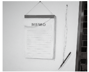
▲メモに使わないで？