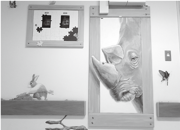
▲飛び出しそうなサイ。実はここ、ドアの一部なんです。あ、チョウが