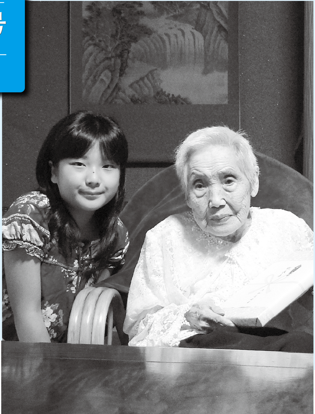
いつまでもお元気で(8月22日:長寿(満100歳)のお祝い)