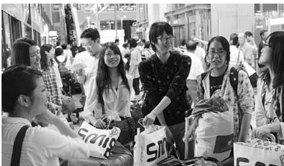
▲閑空に着いてホッとひと息