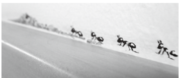
▲手すりの上をアリが行進