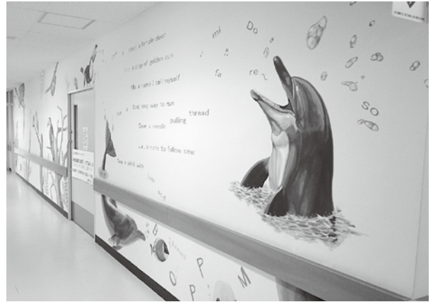
▲イルカの絵には、ドレミの歌が添えられています