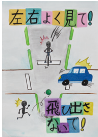
4～6年生の部 最優秀作品 片塩小学校6年 吉阪 敬佑さん 作

応募作品は9月14日～28日の間、市役所2階市民活動室に展示しました。たくさんのご応募、ありがとうございました。