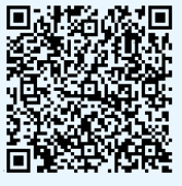
アンドロイド端末