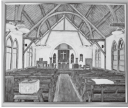
「高田基督教会」 奥村 佳洋