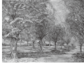
「サザンカホールの黄葉」 辻 元