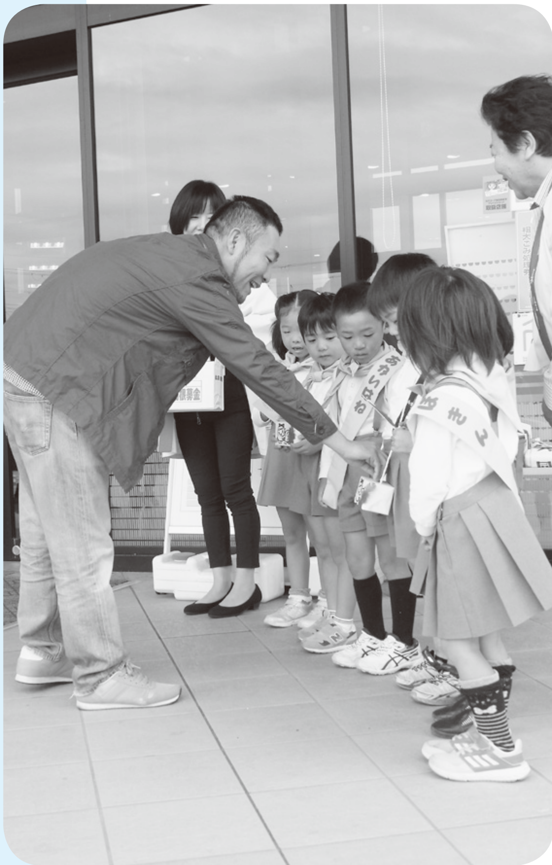
募金を呼びかける子どもたち(10月17日)

大和高田市職員の給与・定員管理などの概要 ①～③ 令和元年度大和高田市職員採用試験案内 ④ 移住・就業・起業支援事業のご案内/令和元年台風19号災害義援金にご協力を ⑤ 令和2年度児童ホーム入所案内/女と男ハートアップフォーラム ⑥ 令和2年度償却資産(固定資産税)の申告 他 ⑦ 市営住宅の入居者募集 他 ⑧ 選奨式 ⑨ 教育委員会表彰 ⑩ 危険業務従事者叙勲 他 ⑪ まちの話題 ⑫ 9月定例市議会 ⑬～⑮ BOOKサロン ⑯ いま、市立病院では ⑰ 人権シリーズ ⑱ 各種相談 ⑲