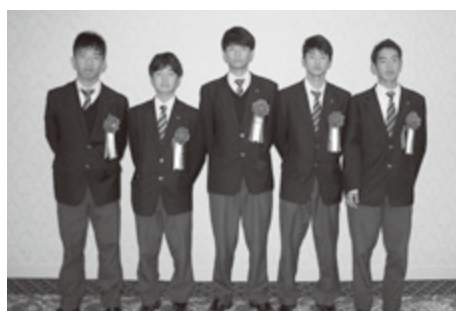
大和高田市立高田商業高等学校 男子ソフトテニス部

多年にわたり、ボランティアとして学校施設の整備に尽力され、快適な教育環境の充実に貢献された功績