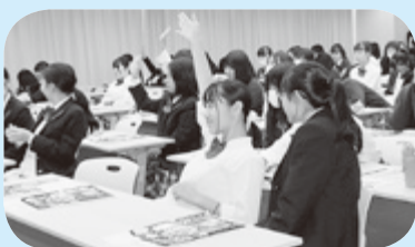
選挙クイズの様子