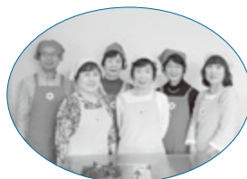
食生活改善推進員の皆さん