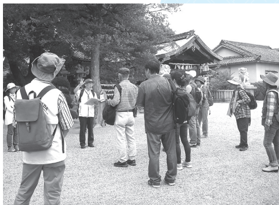
第4回 大和高田の文化財めぐり風景