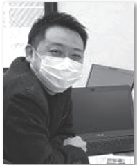
←KoCo-Bizの小杉センター長