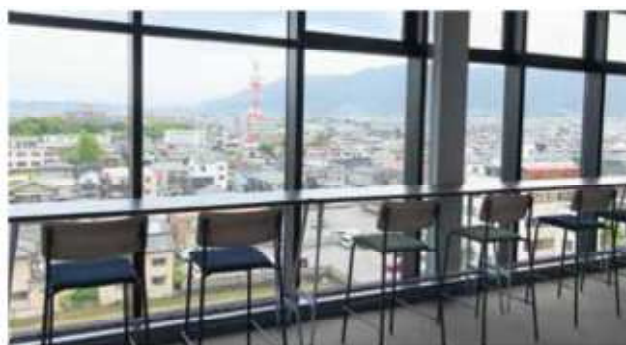
6階 議会フロア展望ロビーからの風景