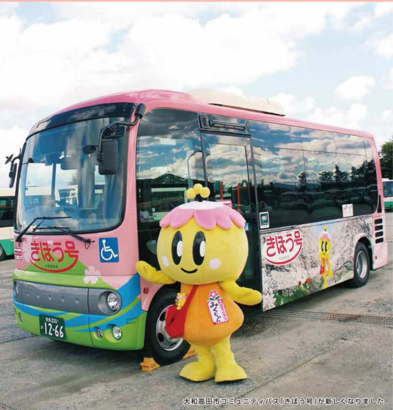
大和高田市コミュニティバス「きぼう号」が新しくなりました

コミュニティバス「きぼう号」リニューアル…2 いま、防災について考える…4 9月定例会市議会…8 新型コロナワクチン接種情報…11 新庁舎見学案内…15