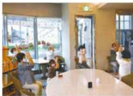
ヨガ体験をしているところです