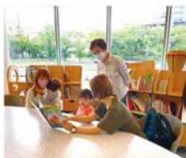
絵本の読み聞かせをしているところです

「きらきら☆ステーション」とは、さざんかホール1階にある誰でも利用できる多世代の交流拠点です。機関車の形をした本棚にたくさんの人から寄贈してもらった本が並べられています。また、子どもが喜びそうな秘密基地のような空間や、