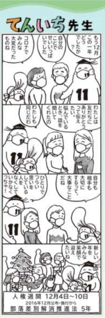
人権週間 12月4日～10日 2016年12月公布・施行から 部落差別解消推進法 5年

言い切りが「い」になる形容詞は様子や状態を表すグループの単語「赤い・大きい・やさしい」など。「い」を省いて「細っ」「旨っ」など自分の感動を短く周りに伝える若者表現もこの十数年で定着しました。