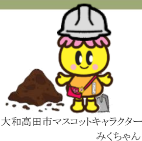
大和高田市マスコットキャラクター みくちゃん

1月は免震装置を設置する階の床部分躯体工事を行いました。 型枠・鉄筋を組立て後、床部分コンクリートの打設し、施工は完了しています。 床コンクリート硬化後、免震装置下部架台を設置し型枠組立後にコンクリートを打設します。 気候変動による強風に充分注意し、また工事用車輛の通行に対する安全と騒音にも配慮して作業を進めていきますので、引き続きご理解とご協力をお願いいたします。