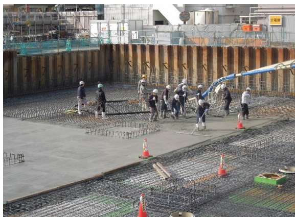
■免震階床コンクリート打設状況

1月は免震装置を設置する階の床部分躯体工事を行いました。 型枠・鉄筋を組立て後、床部分コンクリートの打設し、施工は完了しています。 床コンクリート硬化後、免震装置下部架台を設置し型枠組立後にコンクリートを打設します。 気候変動による強風に充分注意し、また工事用車輛の通行に対する安全と騒音にも配慮して作業を進めていきますので、引き続きご理解とご協力をお願いいたします。