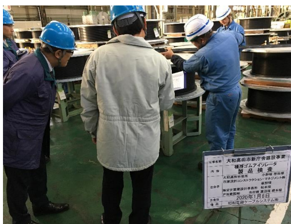
■免震装置工場製品検査状況

写真右上で免震装置架台をセットしたあと、型枠を組立ています。 この後、型枠内にポンプ車を使用して生コンクリートを打設します。