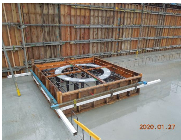
■免震装置下部躯体工事状況

免震装置の下部架台取付状況です。 左の写真で打設した床コンクリートの上に鉄筋を組立て後、免震装置架台を設計図通り位置へセットしていきます。