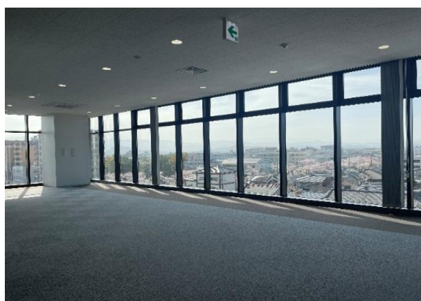
■6階 エレベーターホール状況

3階南側に設けた屋外テラスの写真です。 みなさまにここでくつろいでいただけるように、ベンチやプランターを設置しています。