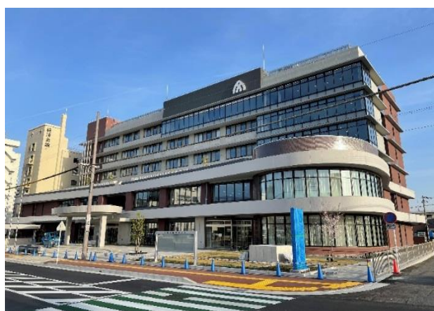
■市役所通り外観(全景)

新庁舎建設工事がこのたび無事竣工し、新庁舎建設事業は完了しました。 この事業において、旧奈良県高田総合庁舎の解体工事及び新庁舎建設工事が、新型コロナウイルス感染拡大防止のために工事を一時中断した時期があったものの、その他は工程の遅れもなく、無事完了できたのは、工事に対する皆様のご理解のおかげです。 建物引渡し後も備品の搬入等により、供用開始(令和3年7月)までもうしばらくお待ちいただくことになるので、写真にて新庁舎の一部をお披露目させていただきます。